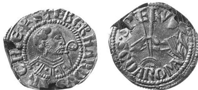
Abb. 8: Denar Erzbischof Eberhards von Trier (1047–1066). Dbg. 476, DMG 346, Weiller 1988, 59.

Der barhäuptige Erzbischof ist mit Tonsur, Meßgewand und Krummstab dargestellt. + EBERHARDVS ARCHIEP[ISCOPV]S . Die aus Wolken reichende Hand Gottes hält zwei Schlüssel, deren Bärte die Buchstaben TE (in Ligatur) und R in der oberen Legende S[ANCTVS] PETRVS bilden (Gott übergibt Petrus die Himmelsschlüssel). Die untere Legende spielt mit SCDA ROMA ( Secunda Roma ) auf die einstige Stellung Triers als zweite Hauptstadt des Römischen Reiches an. Das aus heidnischer und christlicher Tradition schöpfende Münzbild ist ein Ausdruck für das hohe geistige und künstlerische Niveau am Trierer Bischofssitz, das die Trierer Münzstätte sehr vorteilhaft von vielen anderen unterscheidet.