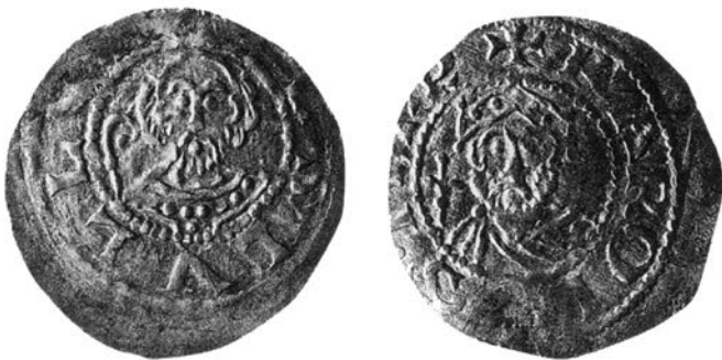
Abb. 10: Abtei Hersfeld, Denar mit Darstellung des heiligen Lullus und Karls des Großen. Dbg. 2095, DMG 471.

Abbildungsnachweis: Alle Münzen stammen aus dem Münzkabinett der Staatlichen Museen zu Berlin – Preußischer Kulturbesitz und sind in doppelter Größe abgebildet.