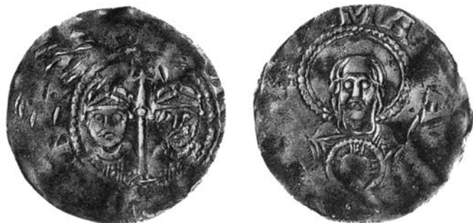
Abb. 3: Denar Heinrichs III. (1039–1056) aus Speyer. Dbg. 829, Ehrend 1976, 28, DMG 143.

Nur über Stempeluntersuchungen lassen sich beispielsweise Prägeumfänge, Aktiv- und Stillstandszeiten sowie Abfolge und Chronologie der Emissionen in den einzelnen Münzstätten erkennen. Auf dieser Basis ist unter Zuhilfenahme einer Formel aus der Wahrscheinlichkeitsrechnung die Gesamtmenge deutscher Münzen im Zeitraum ca. 925 bis 1125 auf 2 Milliarden, die jeweilige (d. h. gleichzeitig kursierende) Umlaufmenge auf 50–100 Millionen Münzen geschätzt worden (Metcalf 1981 und 1993). Die Gretchenfrage ist dabei die Frage, wie viele Münzen mit einem Stempel paar (Ober- und Unterstempel) geschlagen werden konnten, wobei der bewegliche und in der Regel frei geführte Oberstempel dem direkten Hammerschlag ausgesetzt und daher eher verschliffen war als der fest montierte Unterstempel. Die eben genannte Schätzung geht von 10 000 Münzen pro Oberstempel aus. Selbst wenn man nur eine Schlagzahl von 1000 Münzen annimmt, zeigen die Stempeluntersuchungen, daß die Quote des heute erhaltenen Materials weit unter 1 Prozent der einstigen Prägmenge liegt. In Schweden sind allein fast 100 000 deutsche Münzen aus der Zeit von ca. 950 bis 1125 aus Funden bekannt. Sie stehen damit für mindestens 100–200 Millionen deutscher Münzen, die in diesem Zeitraum nach Schweden gelangt sein müssen – und dies ist eine sehr vorsichtige Schätzung. Tatsächlich dürfte die Zahl wohl wenigstens noch verzehnfacht werden müssen,