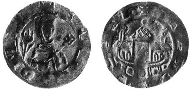
Abb. 11: Denar der Äbtissin Agnes von Quedlinburg (1110–1125?). Dbg. 617.

Oldenbourg: Grundriß der Geschichte. Bd. 6, Fried, J.: Die Formierung Europas 840–1046, 2. Aufl., München 1993; Bd. 7: Jacobs, K.: Kirchenreform und Hochmittelalter 1046–1215, München 1994.