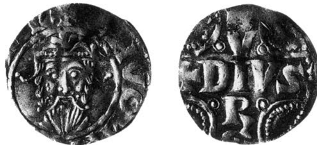
Abb. 2: Denar Konrads II. (1024–1039) aus Duisburg. Dbg. 311, Berghaus 1983b, 1:6b, DMG 92.

Konrad I. (911–919) hat auf dem Totenbett den Sachsenherzog Heinrich zu seinem Nachfolger designiert. Mit König Heinrich I. (919–936) gelangte 919 die sächsische Dynastie der Liudolfinger auf den Thron, die später nach ihren bedeutendsten Vertretern, den drei auf Heinrich I. folgenden Ottos, meist Ottonen genannt wurde, und die nach fünf Herrschern 1024 mit Kaiser Heinrich II. (1002–1024) ausstarb. Wiederum durch Fürstenwahl, wie bereits gut 100 Jahre zuvor, wurde mit Konrad II. (1024–1039) eine neue, die aus Franken stammende Dynastie der Salier inthronisiert. Die Salier stellten vier Herrscher – auf Konrad II. folgten hintereinander drei Heinriche – und sanken 1125 mit dem söhnelosen Heinrich V. (1106 bis 1125) ins Grab. Ein Zwischenspiel mit dem wieder aus sächsischem Herzogshaus kommenden Lothar von Supplinburg (1125–1137) leitete über zur Dynastie der Staufer, die 1137 mit Konrad III. (1137–1152) die Krone erlangten und unter Friedrich I. Barbarossa (1152 bis 1190) den Höhepunkt des mittelalterlichen deutschen Kaisertums setzten.