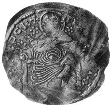
Abb. 7: Denar Herzog Burchards III. von Schwaben (954–973) aus Breisach. Dbg. 901, Maurer 1978, 16, DMG 254.