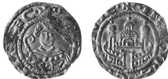
Abb. 9: Denar Erzbischof Annos von Köln (1056–1075). Dbg. 399, Häv. 388, DMG 367.

Der barhäuptige Erzbischof ist mit Tonsur, Meßgewand und Krummstab dargestellt. + EBERHARDVS ARCHIEP[ISCOPV]S . Die aus Wolken reichende Hand Gottes hält zwei Schlüssel, deren Bärte die Buchstaben TE (in Ligatur) und R in der oberen Legende S[ANCTVS] PETRVS bilden (Gott übergibt Petrus die Himmelsschlüssel). Die untere Legende spielt mit SCDA ROMA ( Secunda Roma ) auf die einstige Stellung Triers als zweite Hauptstadt des Römischen Reiches an. Das aus heidnischer und christlicher Tradition schöpfende Münzbild ist ein Ausdruck für das hohe geistige und künstlerische Niveau am Trierer Bischofssitz, das die Trierer Münzstätte sehr vorteilhaft von vielen anderen unterscheidet.