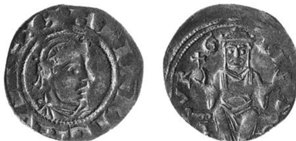
Abb. 4: Denar Heinrichs IV. (1056–1106) aus Duisburg. Dbg. 325, Berghaus 1983c, DMG 163.

Auf der Vorderseite sind nebeneinander Heinrich III. und sein Vater Konrad II. dargestellt. Der zwischen ihnen aufgerichtete „Kreuzstab“ ist vermutlich eine Darstellung der bedeutendsten Reliquie des Reiches, der sogenannten Heiligen Lanze mit einem Nagel vom Kreuz Christi. Die Umschrift +CHONRADI P[ATER] HEINRICI ist Ehrung und Gedächtnis des Sohnes für den Vater. Die Rückseite zeigt eine aus Byzanz entlehnte Darstellung Marias mit dem Jesuskind (Maria orans). Speyer war für die aus Franken stammende Dynastie der Salier ein zentraler Ort. Hier hat Konrad II. den Bau des zur Grablage der Salier bestimmten monumentalen Doms begonnen, der von Heinrich III. fortgesetzt wurde. Die zahlreichen Probemarken (pecks) auf der Vorderseite zeigen, daß diese Münze aus dem Münzverkehr des Ostseeraumes stammt.