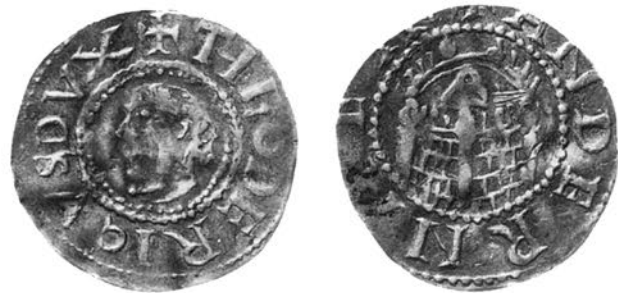
Abb. 6: Denar Herzog Dietrichs I. von Oberlothringen (984–1027) aus Andernach. Dbg. 442, DMG 227.

Der in frontalem Brustbild dargestellte Kaiser trägt den Reichsapfel in der erhobenen Linken und hat die Lanze geschultert. Die Umschrift +HEINRICHUVS IMP legt die Prägezeit nach 1084, dem Jahr der Kaiserkrönung Heinrichs IV., fest. Die Rückseite zeigt ein stilisiertes Stadtbild (Mauerring mit Türmen und Kirche), die Umschrift GOSLARIUM nennt die Münzstätte. Goslar ist wegen seiner Silbervorkommen seit dem 10. Jh. eine wichtige Münzstätte gewesen, die unter Heinrich III. 1047/48 neu eingerichtet und zum Ausgangspunkt einer reichsweiten Umstrukturierung der königlichen Münzprägung wurde. Neben Duisburg und Dortmund ist Goslar der dritte und seit 1050 wichtigste Stützpunkt für die Münzprägung der salischen Herrscher.