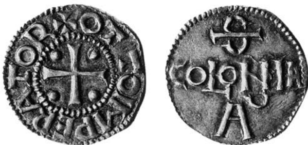
Abb. 1: Denar Ottos I. (936–973) oder Ottos II. (973–983) aus Köln. Dbg. 333, Häv. 62, DMG 20.

Wegen des Kaisertitels ( OTTO IMPERATOR ) kann die Münze erst ab 962 geprägt sein. Die richtige Zuordnung der „Kölner Ottonen“ (der Münzen mit Namen Otto und dem Stadtnamen Kölns) ist ein Hauptproblem der deutschen Numismatik. Die Rückseite mit dem dreizeiligen S[ANCTA] COLONIA A[GRIPPINA] ist einer der verbreitetsten deutschen Münztypen und außerhalb Kölns vielfach nachgeahmt worden.