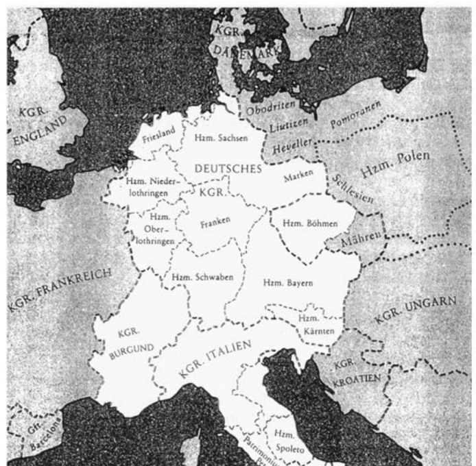
Karte 1: Das Deutsche Reich um die Mitte des 11. Jahrhunderts (nach Keller 1986).

Die räumlichen Grenzen unserer Untersuchung sind die Grenzen des ottonisch-salischen Deutschen Reiches. Das Kerngebiet bestand aus den fünf Herzogtümern Lothringen, Sachsen, Franken, Schwaben und Bayern. Lothringen gehörte 911–925 kurzzeitig zum Westfrankenreich und ist 959 in die beiden Herzogtümer Ober- und Niederlothringen geteilt worden. Während Sachsen und Franken zur Gänze auf dem Gebiet des heutigen Deutschland liegen, umfaßten die westlichen Herzogtümer Lothringen und Schwaben die Gebiete der heutigen Niederlande, Belgiens, Luxemburgs sowie Teile Frankreichs und der Schweiz. Bayern reichte weit in das Gebiet des heutigen Österreich, 976 waren das Herzogtum Kärnten und eine Ostmark ( Ostarrichi , der Kern des späteren Österreich) dem bayerischen Herzogtum ausgliedert worden.