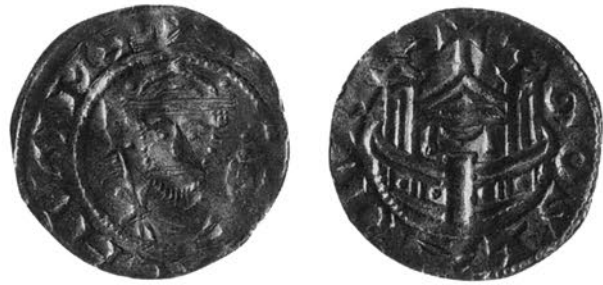
Abb. 5: Denar Heinrichs IV. (1056–1106) aus Goslar. Dbg. 671, DMG 189.